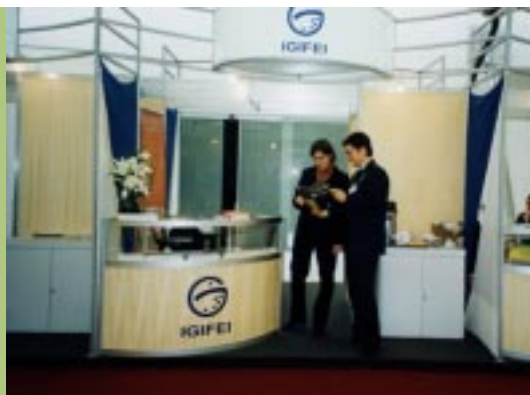
Guia de Boa Cidadania Corporativa 2003 IV Feira da Cidadania/Prêmio ECO 2003