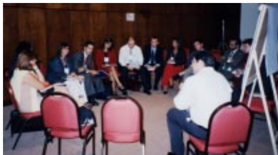
Reunião do Projeto Marco legal e visita do ministro Luiz Dulci ao GIFE